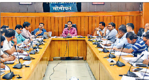
सोनीपत। बैठक में मौजूद अधिकारियों का।

स्वच्छता, सफाई के साथ निकासी को सुदृढ़ व्यवस्था के लिए नाली-सीवर-जोहड़ों को साफ रखना जरूरी है। यदि किसी ने नाली-सीवर-जोहड़ में गोबर डाला तो उस पर जुमाना लगाया जाएगा। साथ ही उन्होंने सड़क मार्गों के निर्माण कार्य के लिए निर्धारित समयसीमा पर काम पूरा न होने को भी गंभीरता से लिया। उन्होंने सख्त निर्देश दिए कि किसी भी उकेदार को पैलट्टी लगाये बिना किसी भी रोड निर्माण को पूर्ण करने के लिए एक्सटेंशन न दी जाए।