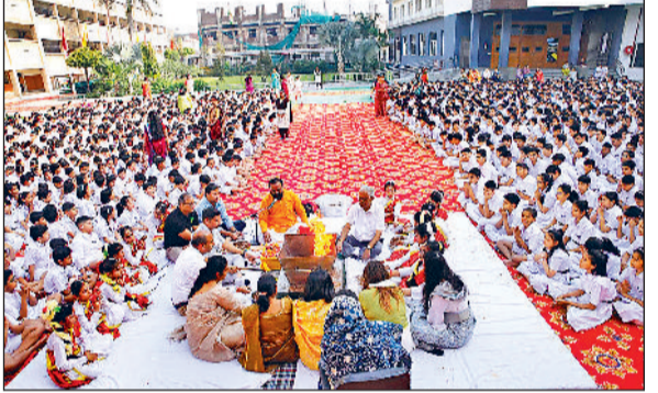
सोनीपत। हवन यज्ञ में उपस्थित विद्यार्थिगण साथ में विद्यालय प्रबंध समिति के पदाधिकारी एवं अन्य।