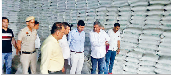
सोनीपत। मिल परिसर में बने गोदाम में जांच अधिकारी को जानकारी देते हुए एमडी चीनी मिल व अन्य अधिकारी।

सोनीपत के चीनी मिल परिसर में बने गोदाम में बिना रिकॉर्ड के लाखों रुपये कीमत की चीनी के भंडारण के गड़बड़ झाले के मामले में जांच अधिकारी गनौर एसडीएम ने बुधवार को चीनी मिल के गोदाम का दौरा किया। साथ ही उन्होंने गोदाम कीपर व शिफ्ट ईंचार्ज के फिर से बयान दर्ज किए हैं। साथ ही मामले में नोटिस पाने वाले 15 कर्मचारियों को बुधवार को बुलाया गया था। मामले में जांच अधिकारी की तरफ से एक सप्ताह में रिपोर्ट तैयार करके उपयुक्त को सौंपने की बात कही जा रही है।