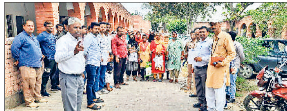
मॉडल टाउन स्थित बीईओ कार्यालय में पहुंचे दल और मंच के पदाधिकारी।

समता सैनिक दल एवं हरियाणा संयुक्त कर्मचारी एकता मंच के बैनर तले मॉडल टाउन स्थित ब्लॉक शिक्षा अधिकारी कार्यालय सोनीपत में बैठक की गई। बैठक में चिराग योजना तथा आरटीई के तहत दाखिलों की मांग उठाई गई। इसके अलावा 10 अप्रैल को होने वाले डा. भीमराव अंबेडकर जयंती में शामिल होने के लिये सदस्यता ग्रहण करवाई गई। दूसरी मीटिंग दोपहर में नगर पालिका कर्मचारी संघ सोनीपत के नेताओं से मीटिंग की गई और 10