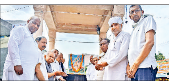
गोहाणा। छत्रपति शिवाजी के चित्र पर पुष्प अर्पित करते हुए नागरिक।