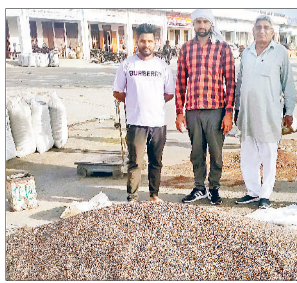
गोहाणा। अनाजमंडी में सरसों लेकर पहुंचे हुए किसान।

किसानों को सरसों की बिक्री में परेशानी का सामना करना पड़ रहा है। अनाजमंडी में केवल उच्च गुणवत्ता की सरसों को ही एमएसपी पर खरीदा जा रहा है। थोड़ी कम गुणवत्ता की सरसों को किसान कम भाव पर व्यापारियों को बेचने पर मजबूर हैं। वर्तमान