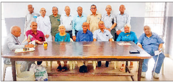
सोनीपत। स्वास्थ्य जांच शिविर में उपस्थित परिषद के पदाधिकारी एवं सदस्यगण।